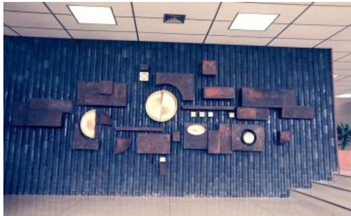
สร้างสรรค์งาน Ceramic แบบ High-Relief