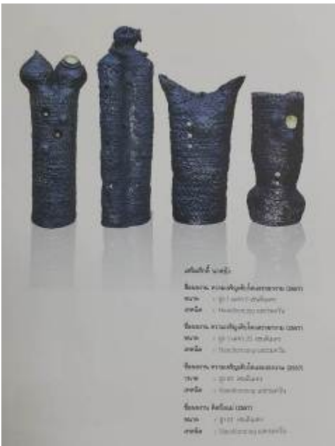
ເປືອນເສັ້ນ (ເປືອນ) (ໄກ່ ມັນ ເຫາດີດີ) ພາກປະເທດ: ຈາວນ້ຳ, ຈຸນປັກ ຜູ້ກວດຄວບ: ສະໜາບຸນຄວາມ 14. 02 ກມ ປັດທະນາ: ສະໜາບຸນ ຕຸກຄົນ: 1.250 °C