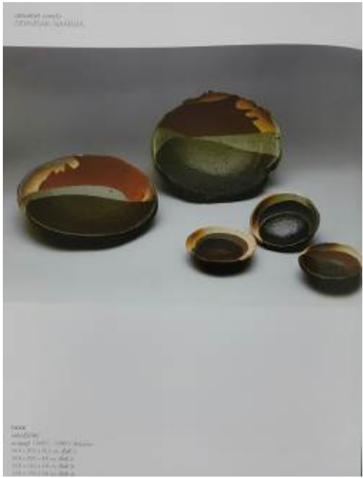
ເປືອນເສັ້ນ (ເປືອນ) (ໄກ່ ມັນ ເຫາດີດີ) ພາກປະເທດ: ຈາວນ້ຳ, ຈຸນປັກ ຜູ້ກວດຄວບ: ສະໜາບຸນຄວາມ 14. 02 ກມ ປັດທະນາ: ສະໜາບຸນ ຕຸກຄົນ: 1.250 °C