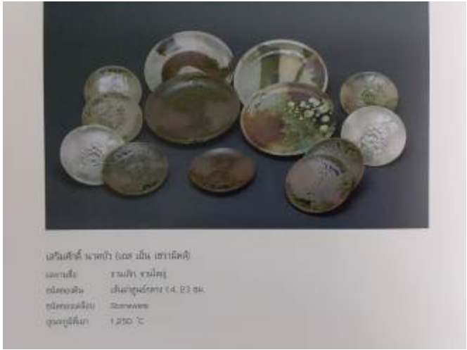
ເງິນເສັ້ນ (ເງິນ) (ໄກ່ ມັນ ເຫາດີດີ) ພາກປະເທດ: ຈາວນ້ຳ, ຈຸນປັກ ຜູ້ກວດຄວບ: ສະໜາບຸນຄວາມ 14. 02 ກມ ປັດທະນາ: ສະໜາບຸນ ຕຸກຄົນ: 1.250 °C