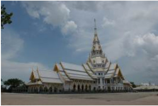
ควบคุมการสร้างซ้อฟ้าใบระกา นาคปัก หางนาค และหน้าบัน ซึ่งทำเป็น Ceramic เคลือบสีทองของ พระอุโบสถวัดโสธรวรารามรวมหาวิหาร จังหวัดฉะเชิงเทรา