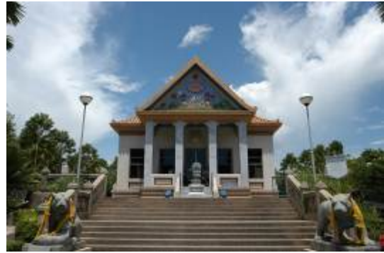
ควบคุมการสร้างหน้าบัน Ceramic แบบ High-Relief วัดธรรมิการามรวมหาวิหาร จังหวัดประจวบคีรีขันธ์